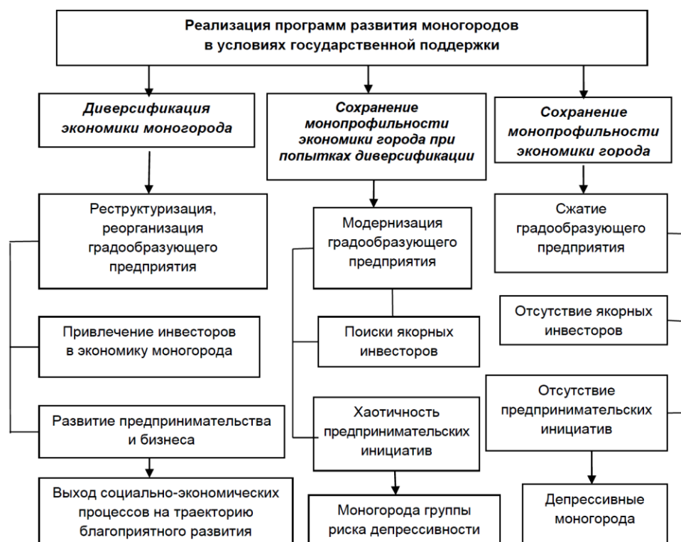
Рисунок 2 – Вариативная модель развития моногородов

Базовые модели поддержки моногородов: диверсификация экономики; утверждение крупных инвестиционных проектов; размещение производств «якорных» инвесторов; поддержка малого бизнеса [6]. Они были применены в 50 моногородах в период 2010–2012 гг., но не решили проблем городов в полном объеме. Генезис развития моногородов в условиях государственной поддержки 2010–2012 гг. представлен на рисунке 2.