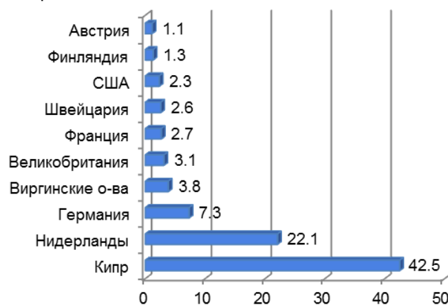
Рисунок 3 – Географическая структура накопленных взносов нерезидентов в акционерный российский капитал в 2011 г., в % [8]

Если посмотреть на страны, импортирующие ПИИ в Россию, то основными инвесторами в России являются Кипр (42,5 %) и Нидерланды (22,1 %) и фактически более половины реальных иностранных инвестиций являются российским же капиталом, возвращенным после налогообложения в оффшорных зонах (рисунок 3). В совокупности на накопленные ПИИ в виде взносов в капитал на долю Кипра, Нидерландов и Виргинских (Британских) островов приходится до 70 %. В случае «оффшорного» происхождения ПИИ собственно теряется реальное экономическое наполнение иностранного капитала в форме ПИИ, поскольку с помощью этой операции реальный собственник выходит из-под юрисдикции России и осуществляет контроль над «своим» предприятием уже в качестве нерезидента, который к тому же получает и налоговые льготы как иностранный инвестор. Ключевыми мотивами вложения капитала иностранными компаниями в отечественную экономику являются: завоевание и достижение монопольного положения на российских рынках, использование более дешевых факторов производства на внутреннем рынке, установление контроля или устранение предприятия-конкурента, продвижение своих товаров на российский рынок.